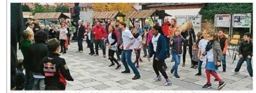
Tanzeinlage: Mittelschüler überraschen die Fairtrade-Marktbesucher in Penzberg mit einem Flachmob.