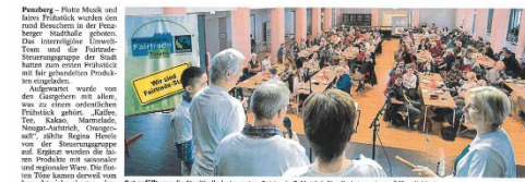
Das Frühstück vor der Stadthalle beim ersten Fairtrade-Frühstück für die bevorstehende Öffentlichkeitsveranstaltung.